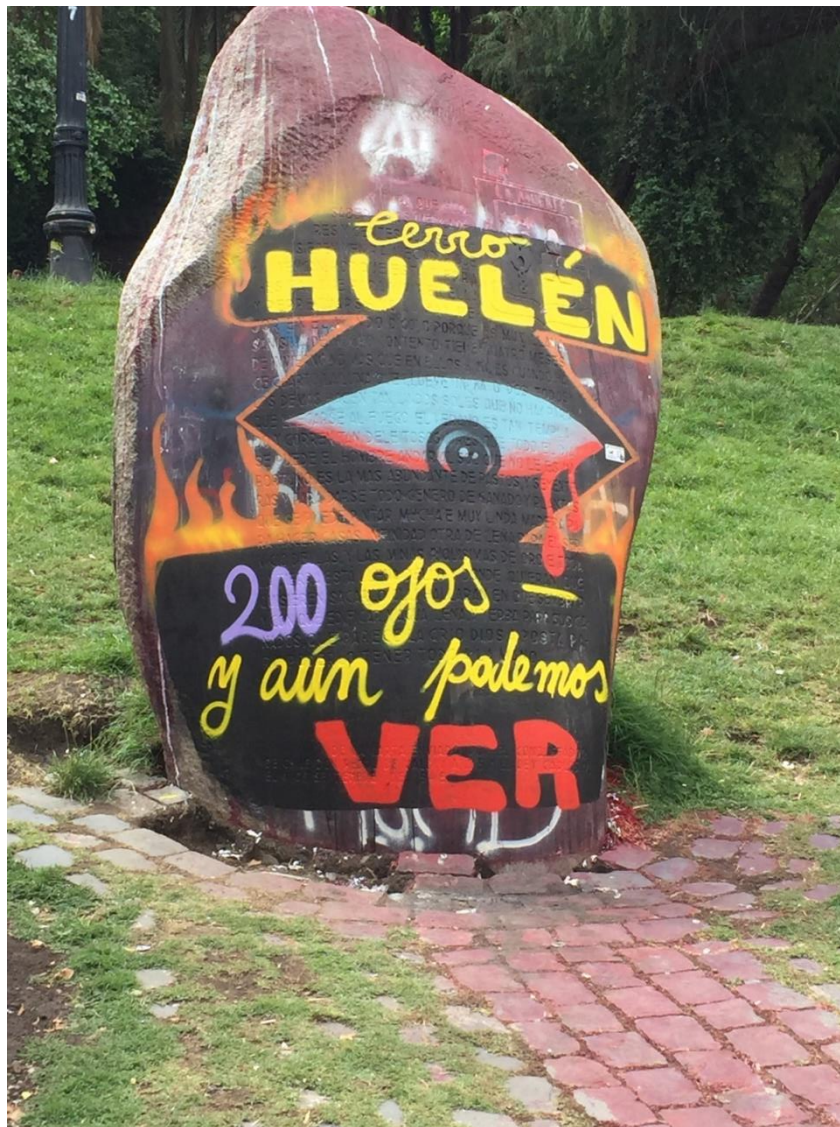
Manifestaciones de la calle.

trasladada las amenazas continuaron. Se establece complicidad del médico que la revisó, pues informó que tenía lesiones leves, lo que se viene abajo al contrastar dicho reporte con los otros informes que se elaboraron con posterioridad. De regreso en la comisaría la encerraron y la obligaron a desnudarse y a hacer sentadillas, siempre presionándola a que guardara silencio. En un momento de estas agresiones unx de lxs agentes policiales indica "Y qué, si ésta es lesbiana", cuestión que valida que este cuerpo no le importa a la policía. El caso, pese a las amenazas, fue difundido por esta joven en el periódico La Zaramora, quien también formalizó su denuncia en el INDH, instancia que presentó una querrela por torturas.