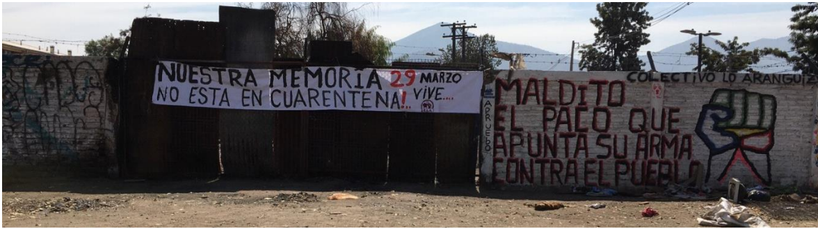
Manifestaciones de la calle.

¿Cómo no comprender el silencio que habita en lo anterior si desde el 18 de octubre del 2019 la violencia de carabineros ha generado un profundo miedo en la gente y consecuencias asociadas a la salud física y mental? Si bien, el discurso insurreccional es de resistencia a la violencia, esto tiene efectos que en distintos espacios se transforma, por ejemplo, en la incertidumbre que provoca encontrarse con algún carabinero, cuyas violencias delictuales son amparadas por la radicalizada agenda de seguridad aprobada por el Parlamento. De hecho, las cifras de personas heridas, mutiladas y asesinadas han seguido incrementándose 2 .