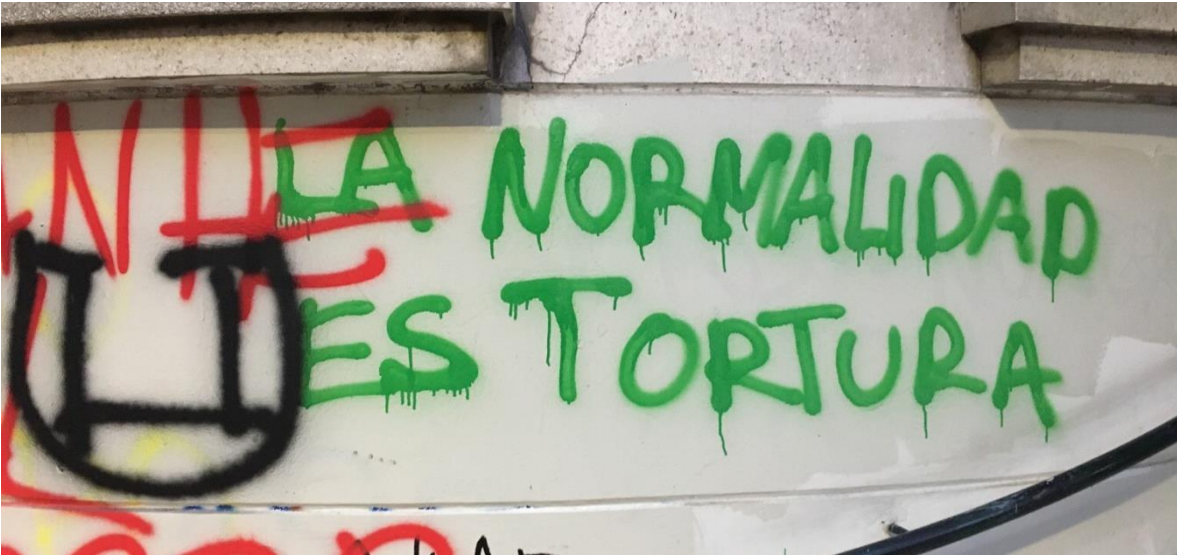
Manifestaciones de la calle.