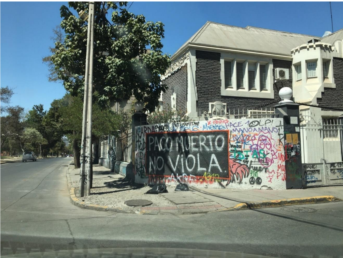
Manifestaciones de la calle.