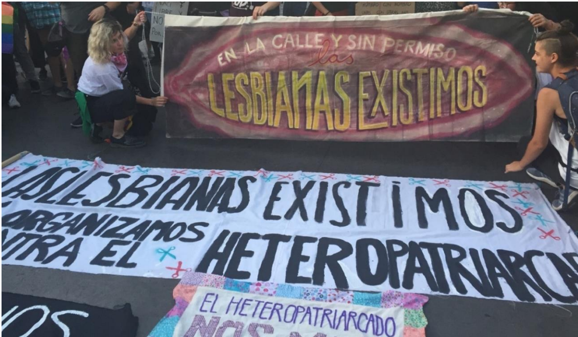
Manifestaciones de la calle.

Este odio del cual hablamos faculta que se aborrezca y reprima todo aquello que se opone al proyecto de la modernidad que para la situación que detona la elaboración de este Reporte son las demandas de lxs insurrectxs que habitan el territorio conocido como Chile. El actual presidente de país, Sebastián Piñera es un ejemplo preciso de lo indicado cuando afirma a varios días de desarrollo de la Insurrección que "(...) estamos al frente de un enemigo poderoso" 6 . Dicho "enemigo" de su proyecto -que, valga la reiteración, es el proyecto de la modernidad- han sido lxs pobres, lxs sin tierra, quienes luchan por la autonomía de sus cuerpxs, quienes ponen los términos de sus territorios devastados en juego. En síntesis, son quienes resisten al colonialismo y sus más de 500 años de ejercicio constrictor.