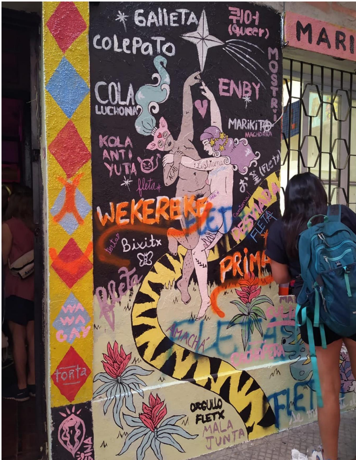
Portada basada en mural colaborativo del Centro Cultural Rogelia.

Diseño y diagramación – Cristián Flores C.