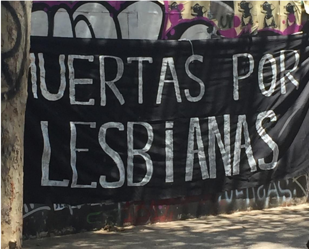
Manifestaciones de la calle.

El abuso policial, que vale decir, en el marco noticioso no ha relevado los costos emocionales de la violencia, se caracterizó por ser ejercido por más de un carabinero que, al mismo tiempo o alternadamente, cometieron los agravios y que, por lo general, fueron policías varones. Destacamos aquí la detención de una pareja gay de Hualpén que por negarse al control de identidad fue violentamente reprimida, lo que incluyó un tiro a quemarropa. Esta pareja, que durante el procedimiento fue tratada de “maricones” fue acusada de intento de asesinato, cuestión que fue contradicha por todxs los vecinxs que filmaron e intentaron disuadir a la policía sin resultados positivos. También, evidenciamos la situación de una persona trans masculina en Copiapó, acusada de elaboración de bombas molotov, cuestión que -al no ser comprobada- derivó en un procedimiento de control de identidad que llevó a la persona a solicitar que le llamaran por su nombre social. Esto devino en su encarcelamiento. Lo indicado devela cómo hechos que están fuera de la ley son maquillados en formato montaje para travestir su ilegalidad y que se detonan, porque en algún momento, son distinguidxs como disidentes sexuales. La pareja gay, de hecho y al ser detectada como tal, gesta un operativo injustificado y el descubrimiento de la identidad de género del joven trans deviene en su encarcelamiento.