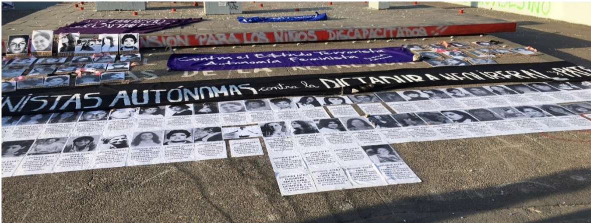
Manifestaciones de la calle.