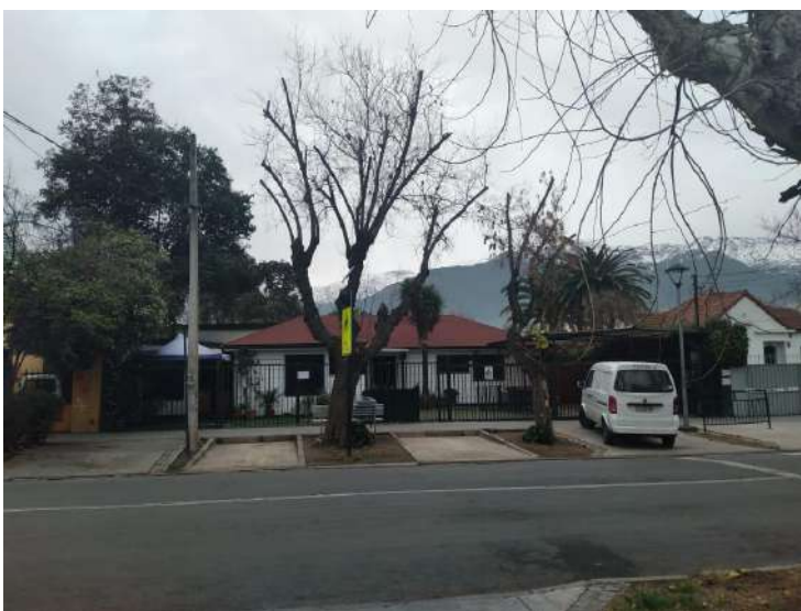
Escuela San Juan Evangelista

Detrás de la casa hay un patio circundado por salas. Puede advertirse tres estacionamientos para los padres y madres que traen a sus hijos, incluyendo párvulos.