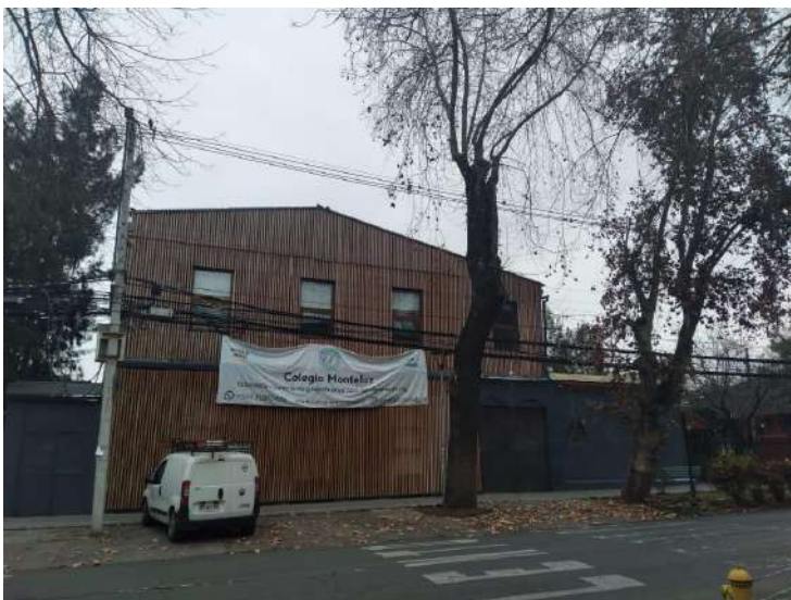
Colegio Monteluz.